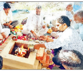
रोहतक। हवन में आहुति डालते हुए आयोजक।