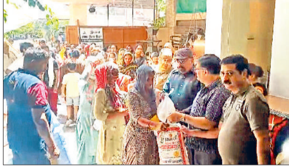
हरिभूमि न्यूज ▶▶ रोहतक

रोहतक सिटी फ्रैंड्स क्लब द्वारा रविवार को 105 जरूरतमंद परिवारों को राशन वितरण किया गया। इस दौरान मुख्य अतिथि महामंडलेश्वर स्वामी कपिल पुरी महाराज रहे। उन्होंने कहा कि रोहतक सिटी फ्रैंड्स क्लब द्वारा किए जा रहे कार्यों की सहायनी की। उन्होंने कहा कि यह पुण्य का काम है। क्लब के प्रतिनिधि राष्ट्रीय जन उद्योग व्यापार संगठन के