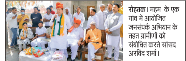
सकते वो लोग प्रदेश को क्या दिशा देंगे। कांग्रेस झूठ का सहारा लेकर लोगों को बरालाने का काम कर रही है, इस झूठ को अब बिकने नहीं देंगे। सांसद ने कहा कि जनता के जनसमर्थन और कार्यकर्ताओं की मेहनत से इस बार वे डेढ़ लाख से अधिक वोटों से विजय श्री हासिल करेंगे, जिससे रोहतक लोकसभा क्षेत्र की जनता ने यह तय कर लिया है। भाजपा सांसद डॉ अरविंद शर्मा ने

भाजपा सांसद एवं रोहतक लोकसभा प्रत्याशी डॉ अरविंद शर्मा ने दीपेंद्र हुड्डा से सवाल पूछते हुए कहा कि वे हरियाणा की राजनीति में 10 साल मुख्य रूप से रहे हैं। दीपेंद्र बता सकते हैं कि उनके पिता भूपेंद्र सिंह हुड्डा जब मुख्यमंत्री थे तो, युवाओं को रोजगार कैसे मिलता था और नौकरी लगती थी तो कितना भ्रष्टाचार उसके अंदर होता था। उन्होंने कहा कि आज वे लोग ईमानदारी से नौकरी देने की बात कर रहे हैं, उन्हें शर्म आनी चाहिए। उन्होंने कहा कि प्रदेश में कांग्रेस कई गुटों में बटी हुई है और जो लोग किसी मुद्दे पर एक साथ नहीं बैठ