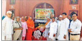
महम। शिवानंद आश्रम खेड़ी महम में रोगियों के लिए फल भेंट करते मानव उत्थान सेवा समिति सदस्य।