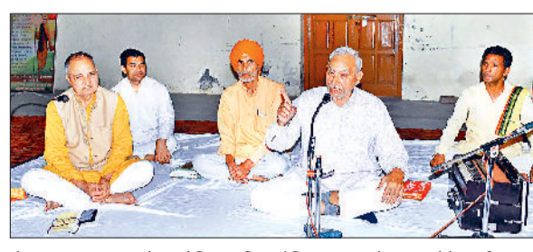
रोहतक। दयानंदमठ में आयोजित मासिक वैदिक सत्संग में प्रवचन देते आर्य।